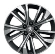
17" MERION, diamond cut, two-tone