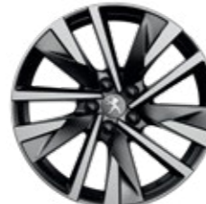
18" Two-Tone Alloy Wheels