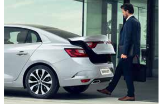
Easy Trunk Access حساس لفتح الشنطة أوتوماتيكيا