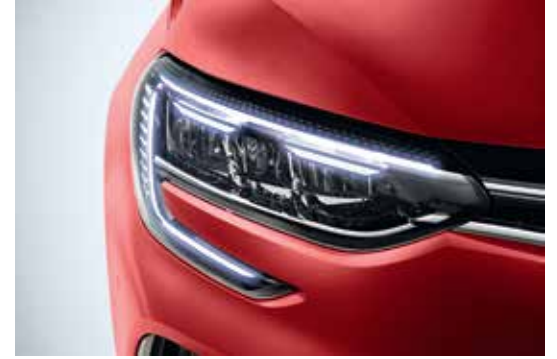
Pure Vision Full LED with C-Shape LED DRL نظام إضاءة LED متكامل مع إضاءة نهائية