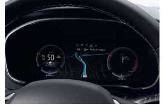
10.2" Digital Cluster Display شاشة عدادات ديجيتال ١٠,٢ بوصة