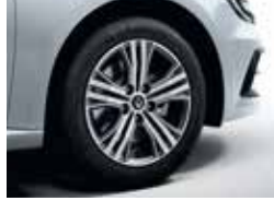
16" Impulse Alloy Wheels