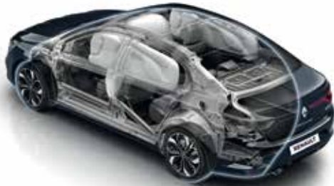
6 Airbags (Front, Side and Curtain) ٦ وسائد هوائية (أمامية - جانبية - ستائر)