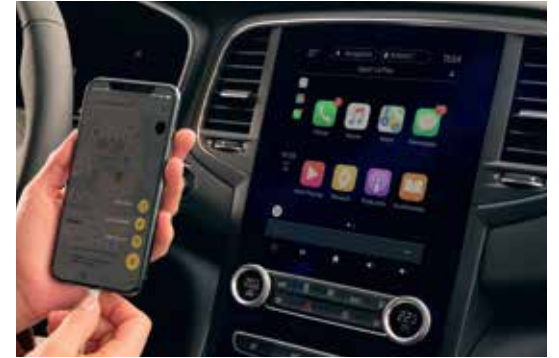
9.3" Touch Screen with Apple CarPlay & Android Auto شاشة ٩,٣ بوصة تعمل باللمس مع تدعيم هواتف أبل وأندرويد