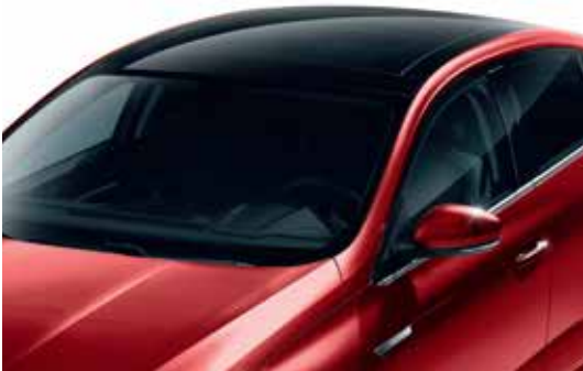
Electric Panoramic Sunroof (Tilt & Sliding) فتحة سقف بانوراما كهربائية