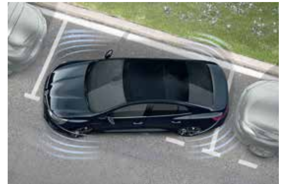
Front & Rear Parking Sensors حساسات ركن خلفية وأمامية