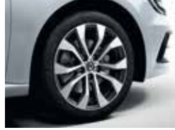
17" Allium Alloy Wheels