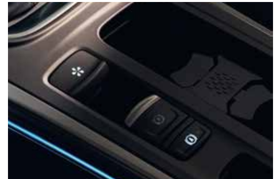
Electronic Parking Brake with Auto Hold Function فرامل يد كهربائية مع نظام تعليق تلقائي لفرامل اليد الكهربائية