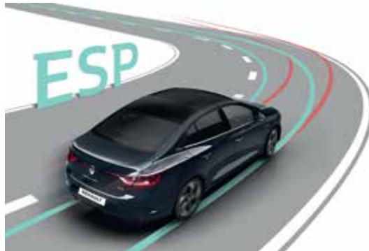
ESP (Electronic Stability Program) نظام الثبات الالكتروني