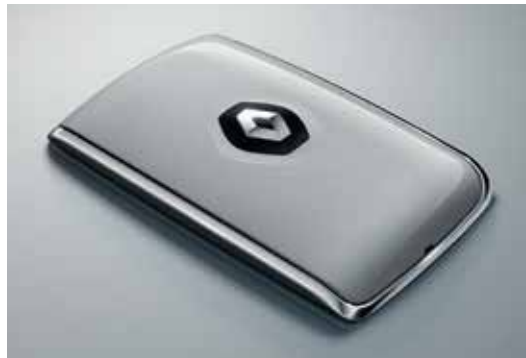
Keyless Entry & Go (Renault Smart Card System) دخول السيارة و تشغيل المحرك بدون مفتاح (كارت رينو الذكي)