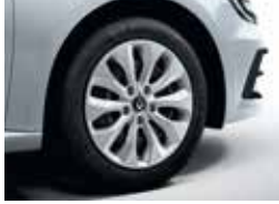
16" Florida Steel Wheels